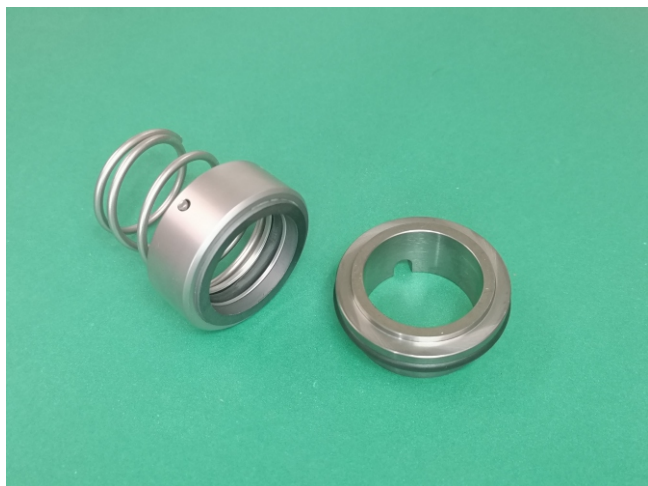
Uszczelnienie SU/GG29 28mm Q11U1EGG d7-43,3 ; L1-38mm