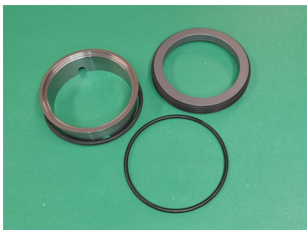
Uszczelnienie mechaniczne pompy Masosine typ SP40: BWMS 65mm U1Q1EGG-SP40 zestaw naprawczy