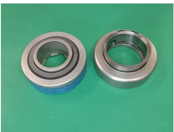
Kompletne uszczelnienie mechaniczne pompy Masosine typ SP40: BWMS 65mm U1Q1EGG-SP40