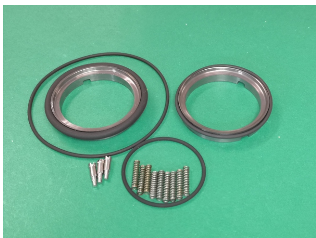
Uszczelnienie mechaniczne : BWJEC 35mm ___-ZL200 wersja pojedyncza