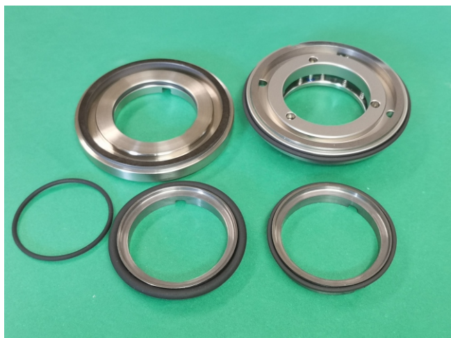
Uszczelnienie mechaniczne :BWJEC 35mm ___-ZL200 wersja podwójna